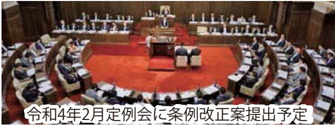
令和4年2月定例会に条例改正案提出予定

※1.本会議では一般質問と会派の代表が行う代表質問がある。 ※2.委員長(8人)は委員会運営に専念するため質問はしていない。 ※3.議員は8つある常任委員会のいずれか一つに所属することになっている。